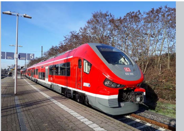
Bild (RMV): Ein PESA VT 633 auf der ersten Testfahrt über die Dreieichbahn

Bodenhöhe Hochflurbereich: 980 mm / 1290 mm